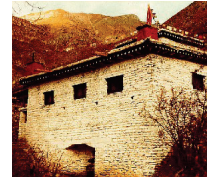
The "Temple Of Miraculous Fire" at Muktinath, Nepal. Photo by Ken Street (November 1979).

[For more on this subject, please read our tract The Temple Of Miraculous Fire. ]